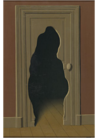
La Réponse imprévue, 1933

6/ Montrez ce qui est caché, et inversement